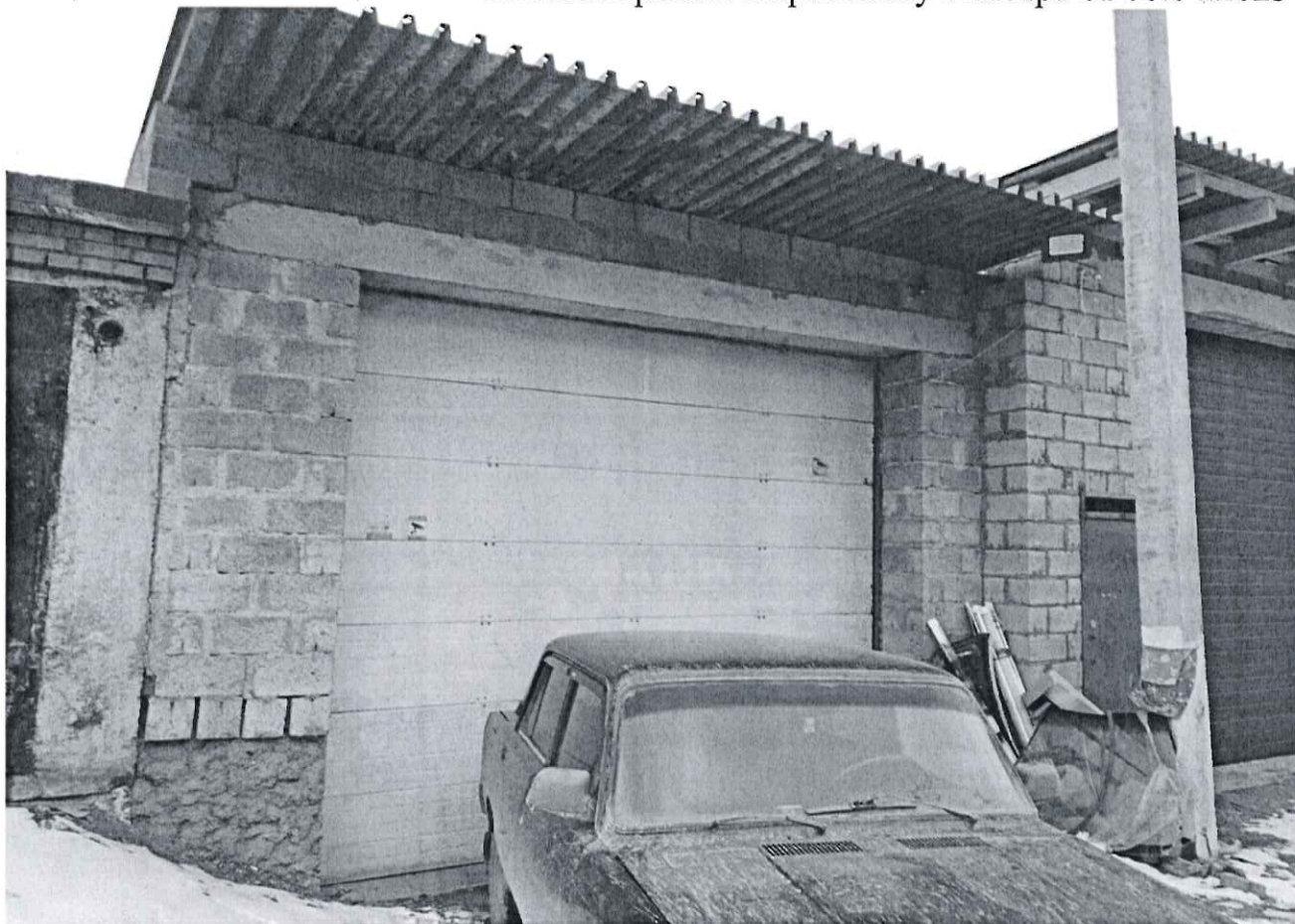
объект № 1