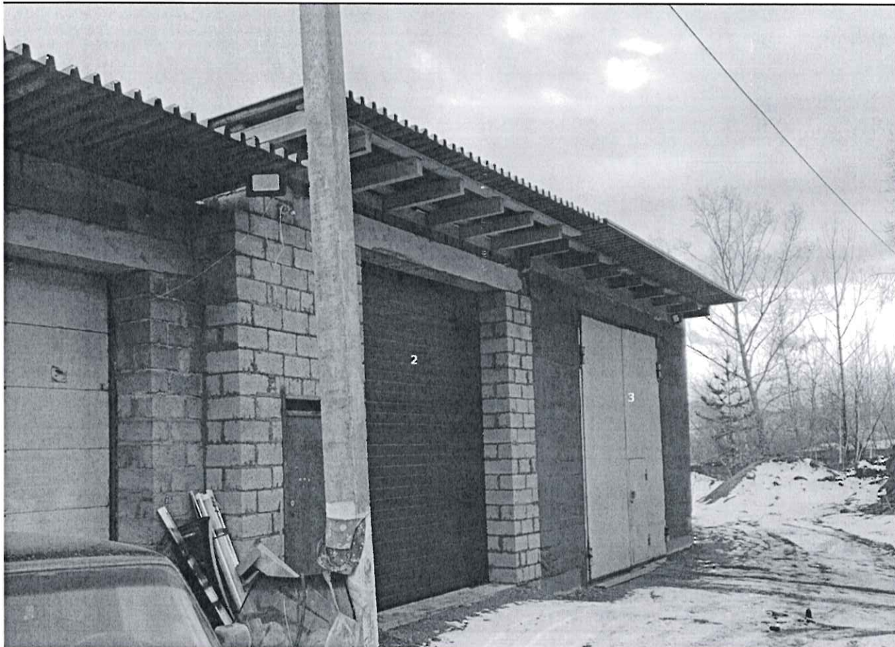
объекты № 2 и № 3

главный специалист отдела муниципального контроля Данилов Д.Л.