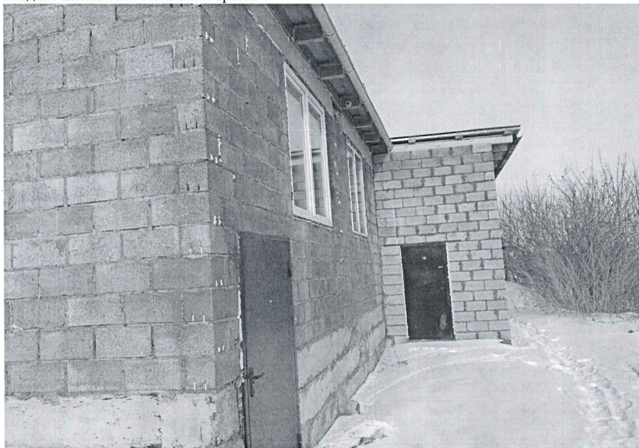
вход на объект № 3 с южной стороны

главный специалист отдела муниципального контроля Данилов Д.Л.